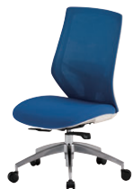
FCM-11…P235 NEW ¥72,700~101,000