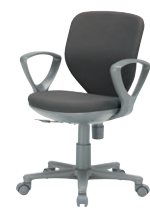
アドフィールライト…P233 ¥36,900~44,800